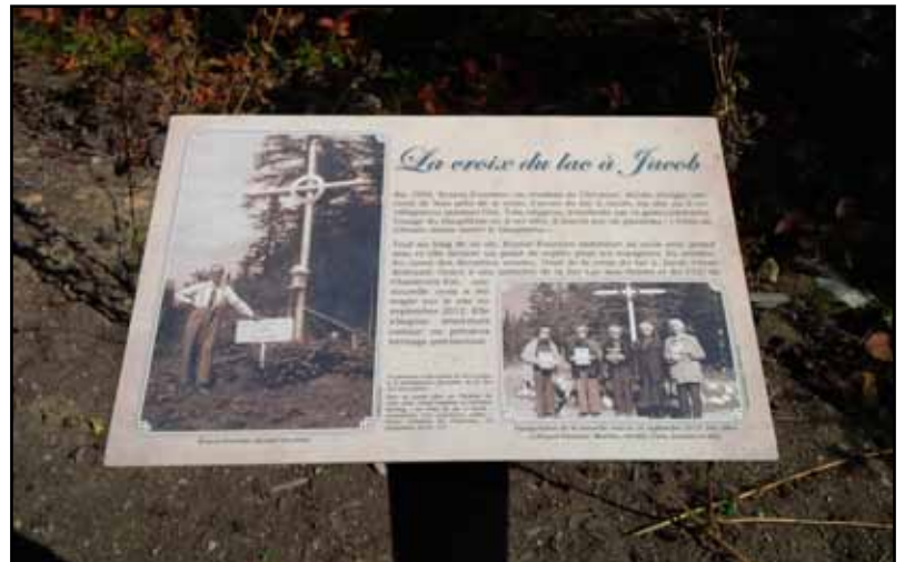
Panneau d'interprétation au Lac à Jacob